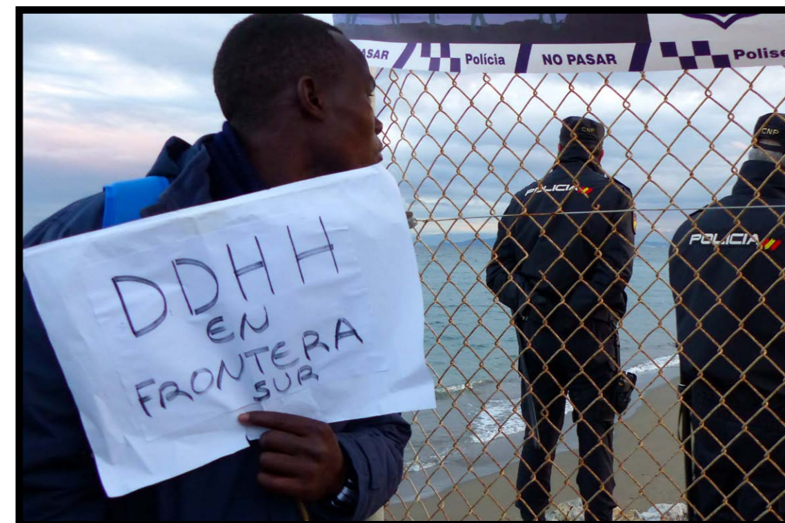
Conmemoración para las muertes de Tarajal, febrero 2015