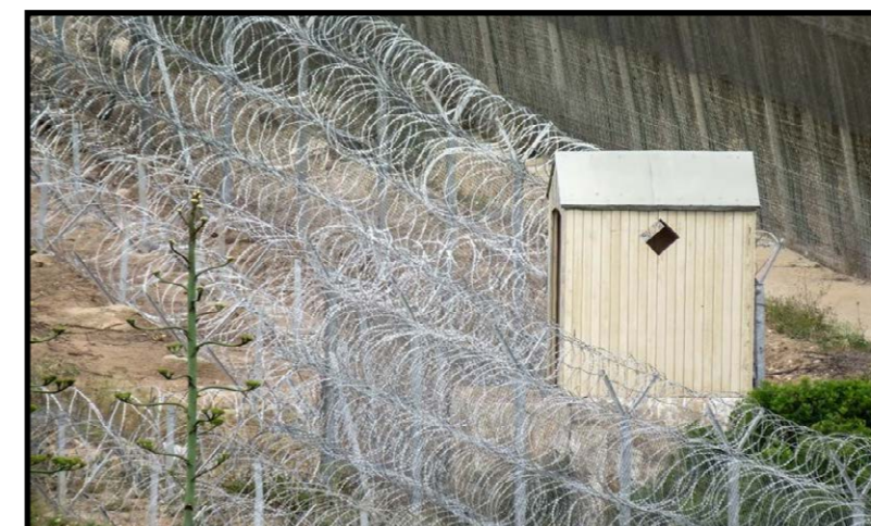
La valla marroqui rodeando la triple valla española de Melilla, junio 2015, José Palazón (PRODEIN)