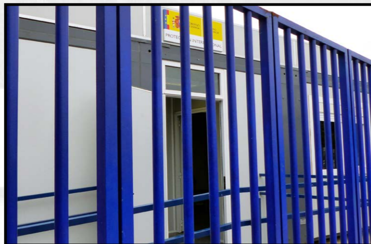
Oficina de asilo en la frontera de Melilla, junio 2015

La legalización de las “devoluciones en caliente” –que viola el principio de no devolución de las personas que buscan protección internacional- no parece estar en contradicción con la reciente apertura, en marzo de 2015, de oficinas dedicadas a las demandas de asilo en las fronteras de Ceuta y Melilla. ¿Hay que ver en ello una política de imagen a favor de los derechos humanos, en el momento en que legaliza lo ilegal? Poco antes de su inauguración, el ministro de Interior español Jorge Fernández Díaz declaraba “que es evidente” que las personas migrantes que saltan la valla no tendrán derecho a