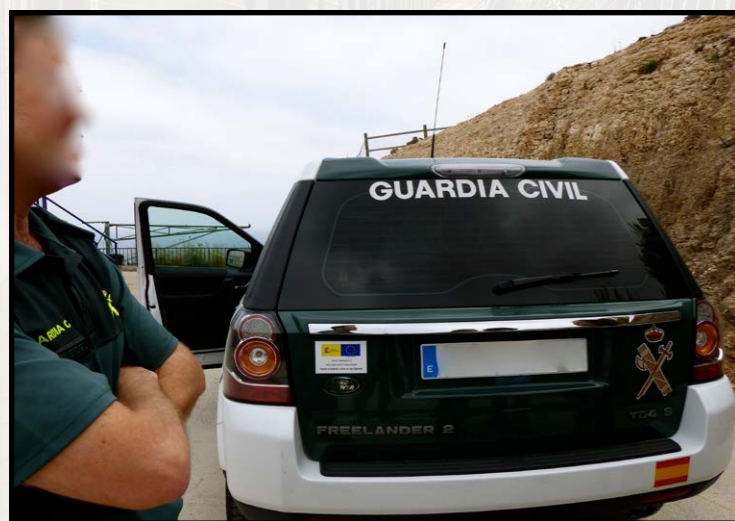
Guardia Civil de Melilla, junio 2015, E.Tyszler Vehículo cofinanciado por el Fondo Europeo para las Fronteras exteriores – Programa de Solidaridad y Gestión de los Flujos Migratorios

Aunque existe una legislación española de extranjería, Ceuta y Melilla han dispuesto siempre de un “régimen de excepción” 2 debido a su extraterritorialidad geográfica. Sin duda también por su interés político de cara a “seleccionar” previamente las personas migrantes que quieren convertirse en candidatas a la inmigración a España y, más allá, a la Unión Europea, constituyendo así una auténtica última “zona de filtro”.